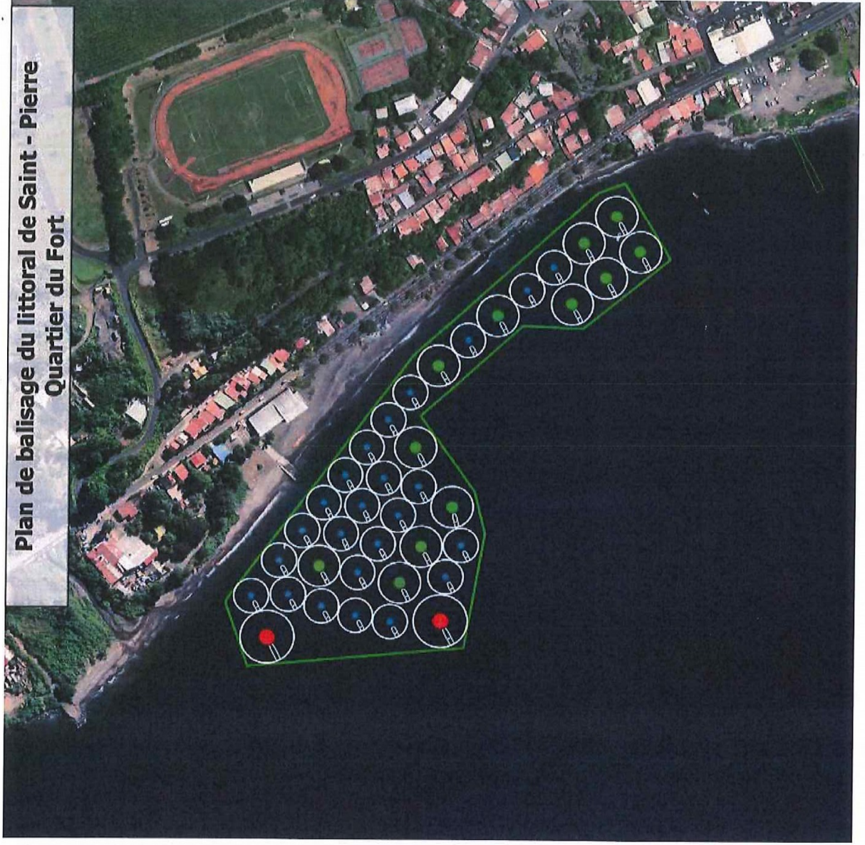
Annexe 1 : plan d'implantation des dispositifs de mouillage